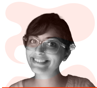
Attachée de presse

attachée de presse culturelle dans plusieurs festivals publics et privés.